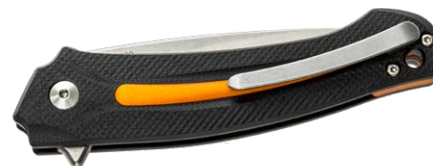
MK FX01-MG OR