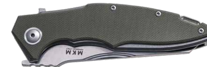
MK VP01-GB GR