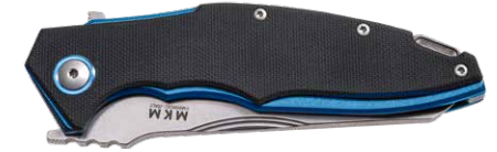
MK VP01-GB BK