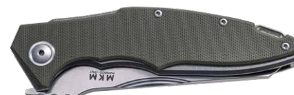
MK VP01-GF GR