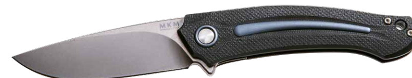
MK FX01-MG GY