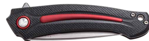
MK FX01-MG RE