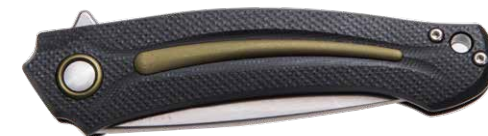
MK FX01-MG GR