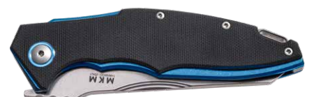
MK VP01-GF BK